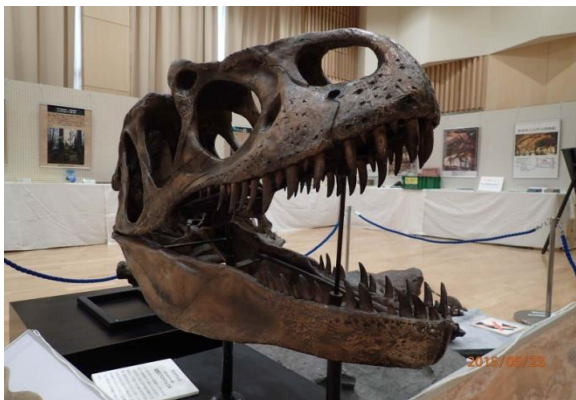
迫力ある展示物 ／博物館所蔵の実物化石・レプリカ・剥製を多数展示。