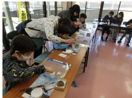
レプリカづくり ／石こうを使ってアンモナイト化石のレプリカづくりを体験。