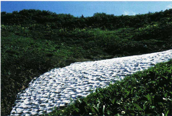
左上：第二次奥利根総合学術調査風景 左下：利根川水源の雪渓 右：本流の難所 シッケイガマワシ

本県をはじめ、関東地方の人々にはなじみ深い利根川。しかし、その険しい地形のため、源流域に足を踏み入れた人はごくわずかです。本県では、明治時代から水源探検を行い、1970年代以降は、2度にわたる学術調査で利根川源流域の自然を明らかにしていきました。