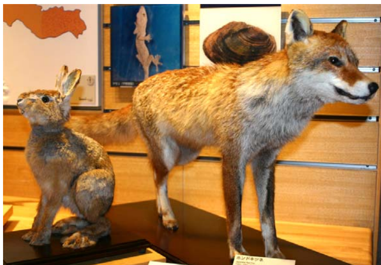
ア ウサギ イ キツネ

さわることのできるウサギとキツネのはくせいがあります。どちらの動物 どうぶつ の毛がやわらかいでしょうか？記号を○でかこみましょう。 (ヒント: ていねいにさわってたしかめてね)