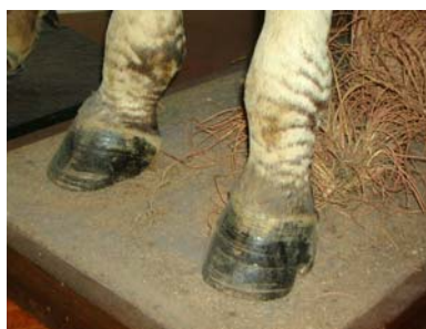
A (ウマの仲間) なかま

オグロヌーのはくせいをさがしてください。この動物の足は次のうちの どうぶつ つぎ どれですか。記号を○でかこみましょう。 きごう