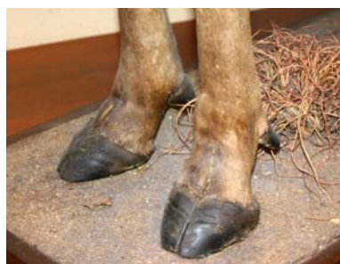
B (ウシの仲間) なかま