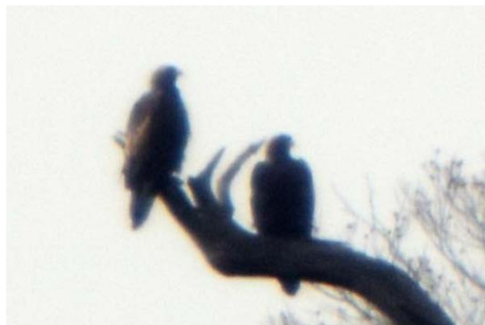
「赤谷の森」のイヌワシのつがい（左：2014年10月23日、右：2015年11月7日）