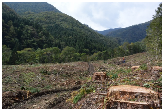
伐採後の試験地（2015年10月4日）