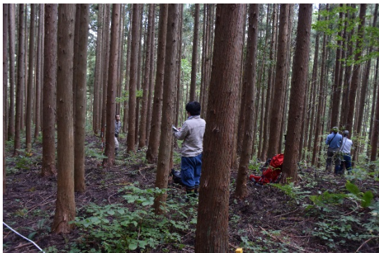
伐採前の試験地（2014年9月20日）