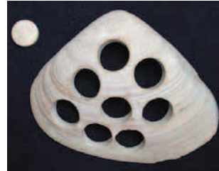
ハマグリから基石を作る

こうしてみると、私たちは様々な種類の貝類を食べていることがわかります。お寿司屋さんのネタケースの中身は3割くらいが貝類なのです。けれどもこんなに身近なわりには、その特徴や生きている様子については余り知られていません。