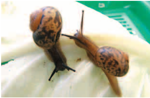
ウスカワマイマイ

その一方で、魚屋さんの店先や、お寿司屋さんのカウンターを思い出した方もいることでしょう。食材としての貝類にはたくさんの種類があり、巻貝の仲間（腹足類）には、サザエ、ツブガイ、バイガイ、アワビなどが、二枚貝の仲間（斧足類）には、シジミ、アサリ、ハマグリ、カキ、ホタテガイ、アオヤギ、ミルガイ、タイラギなどがあります。また意外かもしれませんが、イカやタコも頭足類という貝の仲間です。