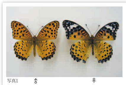
写真1 ♂ ♀