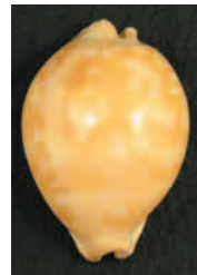
オオサマタカラガイ