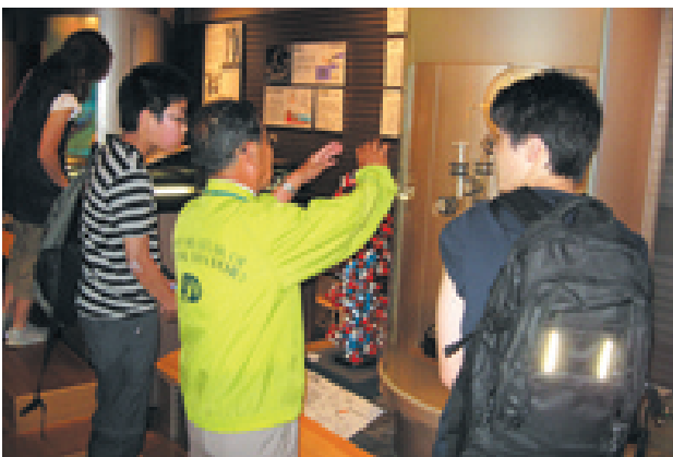
展示室で説明をする解説ボランティア

「ボランティアスタッフジャンパーを着て博物館で活動してみませんか」博物館をより一層楽しむこ