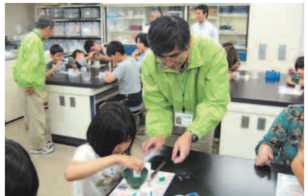
実験室で説明をするサタデーボランティア

規メニューの開発にも参加していただいています。興味のある方は、ボランティアとして参加してみたいかがでしょうか。