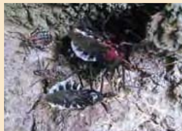
脱皮後間もないと見られる赤みがかった個体と幼虫らしきもの。

動き始めた脱皮直後の個体には、他の成虫が迎えに来て前肢をとってやっているように見えました。