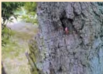
このような、自宅梅の木で発見!