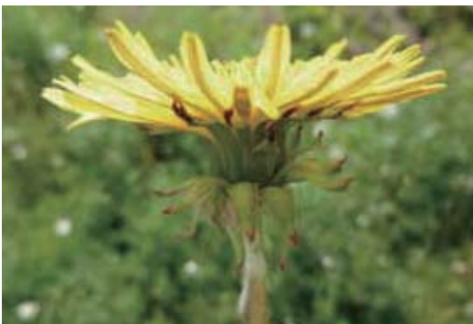
セイヨウタンポポ