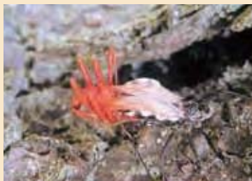
赤い脱皮中のものも発見。約20分で脱皮完了。

自宅の梅の木で見たことのない虫を発見しました。しかも赤い脱皮中のものも。写真は脱皮をしているヨコヅナサシガメの様子です。ヨコヅナサシガメは元々は中国から東南アジアに分布していたものが、昭和初期、九州に入ってきました。1990年代に関東地方でも見かけられ始めたとのこと。ケムシなどに口吻を突き刺し体液を吸います。不注意に触れると、この口吻で刺されることがあるので注意が必要です。体の縁の白色は警戒柄なのでしょうか…。(23-037 三友 賢一)