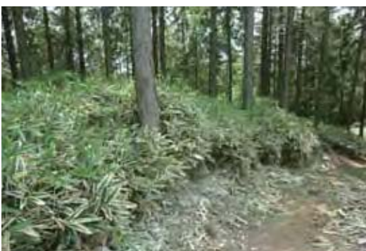
スギ林下部のクマザサ